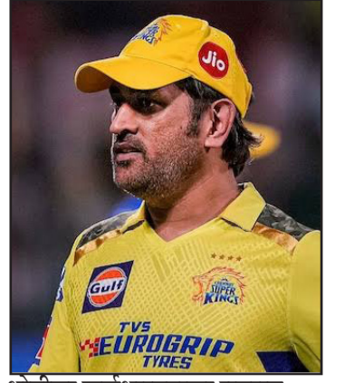
धोनीचा कर्णधारपदाला रामराम पान ४

किंमत - १२ रु. | पाने- ०४ | पुणे आवृत्ती