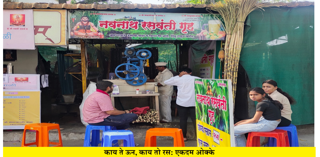
काय ते ऊन, काय तो रस: एकदम ओक्के

मनसेचे कार्यकर्ते झाले. या दोन्ही पक्षातून त्यांना चार वेळा त्यांनी चार वेळा निवडणूक लढवली.